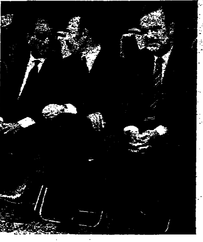
الرؤساء السادات والاصدورمدين في الرياض امس الاول

وقال الصنبر انه تم خلال هذه اللقاءات، تبادل الاحاديث حول القضايا والتعاون الراهنة التي تهم الامة العربية. وقال الصنبر انه تم خلال هذه اللقاءات، تبادل الاحاديث حول القضايا والتعاون الراهنة التي تهم الامة العربية. وقال الصنبر انه تم خلال هذه اللقاءات، تبادل الاحاديث حول القضايا والتعاون الراهنة التي تهم الامة العربية.